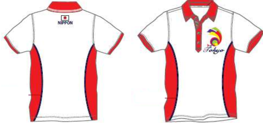
＜役員用ポロシャツ＞