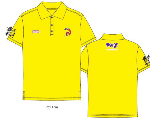
＜役員用ポロシャツ＞