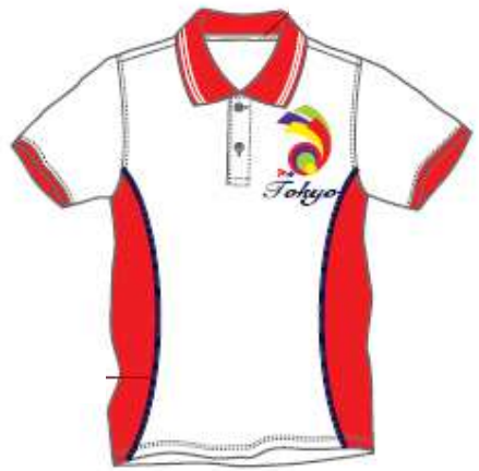
＜選手用ポロシャツ＞