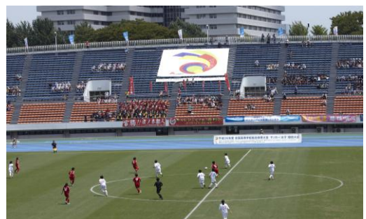
【駒沢オリンピック公園総合運動場陸上競技場】