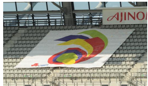
【味の素スタジアム】