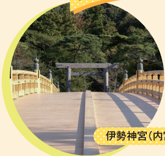
伊勢神宮(内宮)・宇治橋