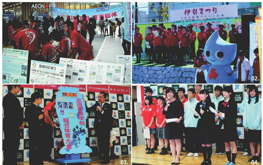
01.北地区(北地区推進委員が参加)平成29年10月1日(日)イオンモール東員にて開催 02.南地区(南地区推進委員が参加)平成29年10月8日(日)伊勢まつり会場にて開催 03.04.中地区(県推進委員、中地区推進委員会が参加したメインイベント)平成29年11月4日(土)イオンモール鈴鹿で開催

高校生が制作したカウントダウンボードの除幕式や競技の実演、インターハイマスコットキャラクターのウイニンくんとの写真撮影、生演奏やゲストトーク等を行い、各会場は大変盛り上がりしました!