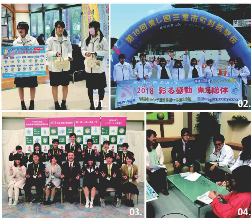
01.02地域のショッピングモールやスポーツイベントでのPR活動 03.知事と生徒委員 04.CATV局でミサンガの説明をする推進委員

【高校生活動推進体制】学校推進委員会を三重県高等学校体育連盟加盟の県立・私立68校(平成30年から67校)に設立するとともに、北・中・南の3つの地区推進委員会、各地区の代表生徒で構成する県推進委員会を設立し、活動してきました。