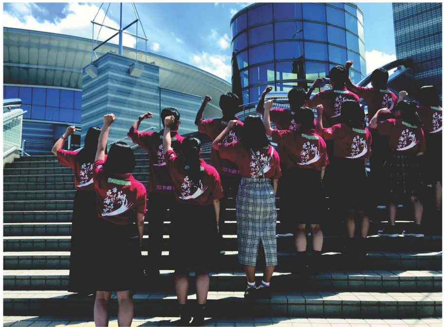
三重県高校生活動推進委員会(15人)

たくさんの人にインターハイを応援してもらえよう県内各地でのPR活動を行うなど、より良い大会にするため力を合わせて活動してきました。